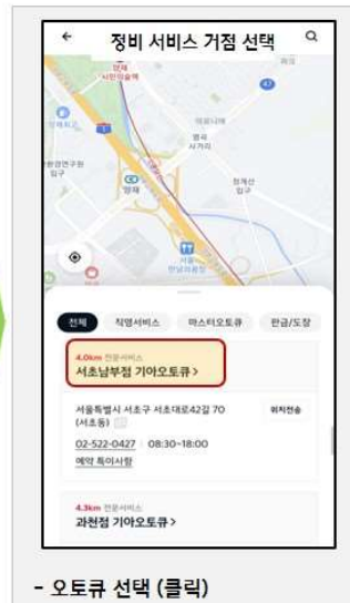
- 오토큐 선택 (클릭)