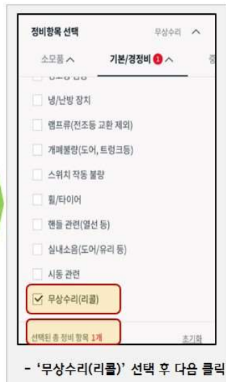
- '무상수리(리콜)' 선택 후 다음 클릭