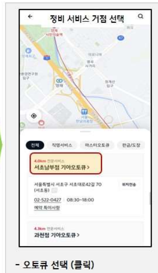
- 오토류 선택 (클릭)