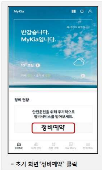
- 초기 화면 '정비예약' 클릭

* MyKia주요서비스 : △ 정비예약, △ 정비이력관리, △ 신차정보 등