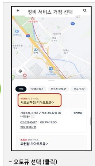
- 오토류 선택 (클릭)