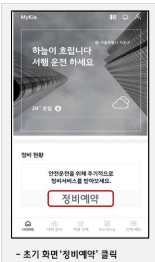
- 초기 화면 '정비예약' 클릭

* 모바일App 이용 시 예약센터 유선 상담전화 연결 지연에 따른 불편없이 간편 리콜예약 가능 * MyKia주요서비스 : △ 정비예약, △ 정비이력관리, △ 신차정보 등