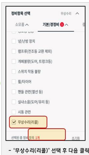
- '무상수리(리콜)' 선택 후 다음 클릭