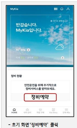
- 초기 화면 '정비예약' 클릭

* MyKia주요서비스 : △ 정비예약, △ 정비이력관리, △ 신차정보 등