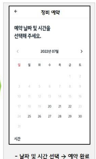
- 날짜 및 시간 선택 → 예약 완료