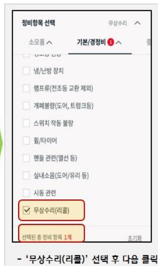
- '무상수리(리콜)' 선택 후 다음 클릭