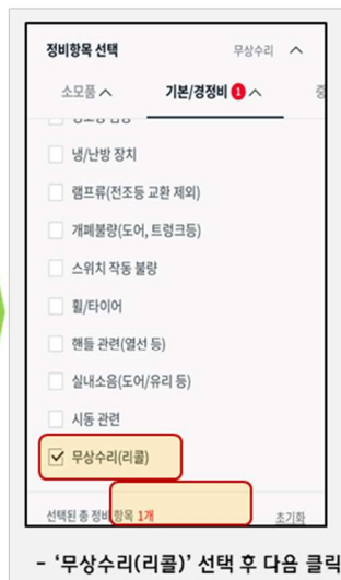
- '무상수리(리콜)' 선택 후 다음 클릭