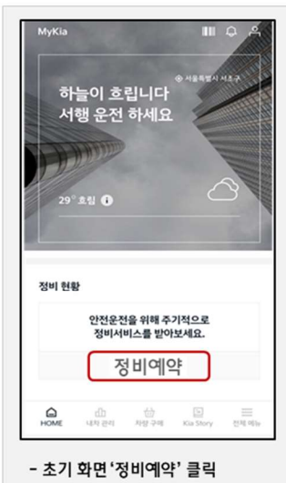
- 초기 화면 '정비예약' 클릭

* MyKia주요서비스 : △ 정비예약, △ 정비이력관리, △ 신차정보 등