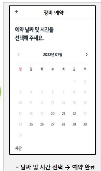
- 날짜 및 시간 선택 → 예약 완료