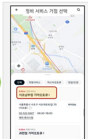
- 오토류 선택 (클릭)