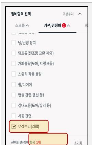
- '무상수리(리콜)' 선택 후 다음 클릭