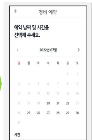
- 날짜 및 시간 선택 → 예약 완료