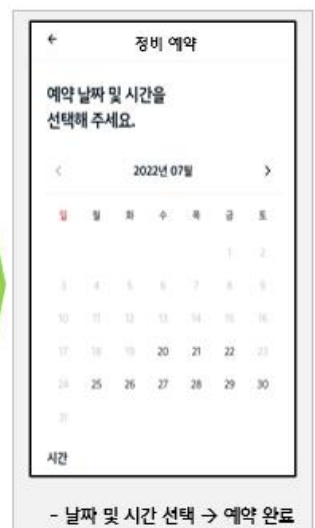
- 날짜 및 시간 선택 → 예약 완료