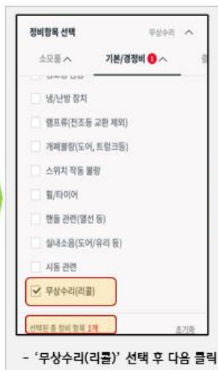
- '무상수리(리콜)' 선택 후 다음 클릭