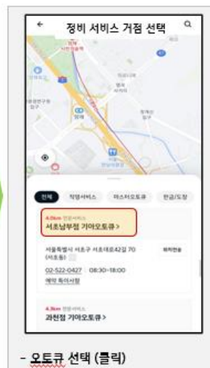
- 오트큐 선택 (클릭)