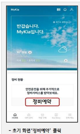
- 초기 화면 '정비예약' 클릭

* MyKia주요서비스 : △ 정비예약, △ 정비이력관리, △ 신차정보 등