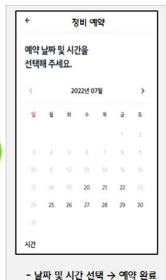
- 날짜 및 시간 선택 → 예약 완료