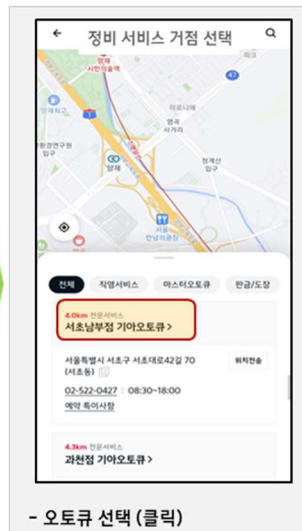
- 오토큐 선택 (클릭)