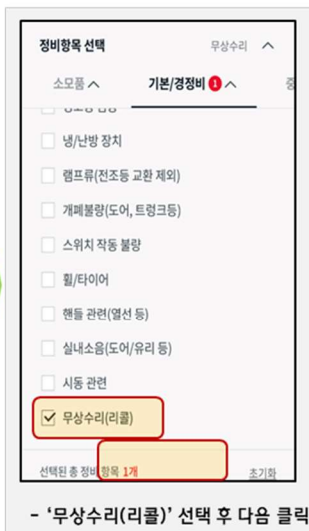
- '무상수리(리콜)' 선택 후 다음 클릭