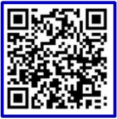
( 안드로이드 )