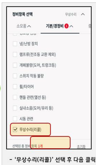
- '무상수리(리콜)' 선택 후 다음 클릭