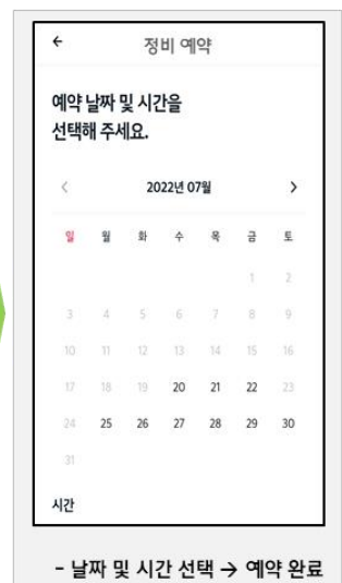
- 날짜 및 시간 선택 → 예약 완료