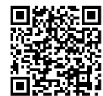
무선 업데이트(OTA) 소개

업데이트시 품질 안정성 확보를 위하여 일정기간에 걸쳐 순차적으로 진행되는점 양해 부탁드립니다, 자세한 내용은 오너스메뉴얼 참조 및 제네시스 고객센터로 연락주시길 바랍니다.